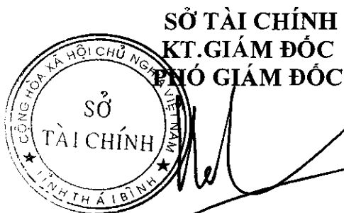
Phan Tự Long

2. Mức giá nêu tại điểm 1 Công bố này là cơ sở để Chủ đầu tư các công trình sử dụng vốn Nhà nước áp dụng và các công trình sử dụng nguồn vốn khác tham khảo để lập và quản lý chi phí đầu tư xây dựng công trình ./.